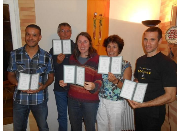
Feliĉaj diplomitoj en 2012 !

Esperanto-Kultur-Centro partoprenis la ekzamen-tagojn en 2012 kaj 2013, sed devis rezigni pri ĝi la pasintan jaron pro manko de interesatoj. Hodiaŭ, je la ĵusa komenco de 2015, mi povas kun granda plezuro anonci, ke la ekzamenoj okazos ĉi-jare en Tuluzo danke al la aliĝo de jam sufiĉa nombro de kandidatoj!